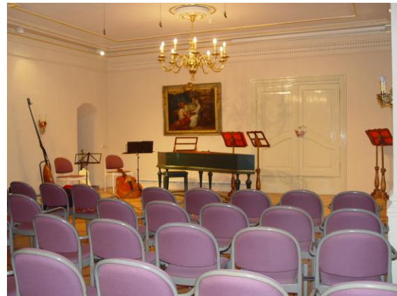
Tagungsort Händel-Haus, Außenansicht und Kammermusiksaal

Zum Einstieg in die Tagung präsentiert das SiLK-Projektteam das Thema „ Kulturgutschutz und die Konferenz Nationaler Kultureinrichtungen “. Aktuelle Schadensereignisse und Katastrophen in Sammlungseinrichtungen zeigen die Dringlichkeit, mit der die Institutionen unterstützt werden müssen, um ein professionelles Sicherheitsmanagement zu etablieren.